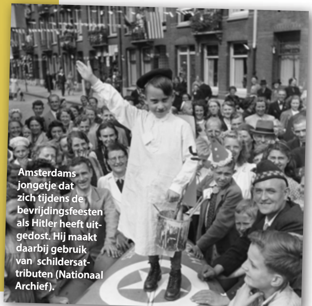
Amsterdams jongetje dat zich tijdens de bevrijdingsfeesten als Hitler heeft uitgedost. Hij maakt daarbij gebruik van schildersattributen.