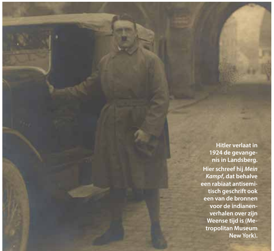
Hitler verlaat in 1924 de gevangenis in Landsberg. Hier schreef hij Mein Kampf , dat behalve een rabiaat antisemitisch geschrift ook een van de bronnen voor de indianenverhalen over zijn Weense tijd is (Metropolitan Museum New York).