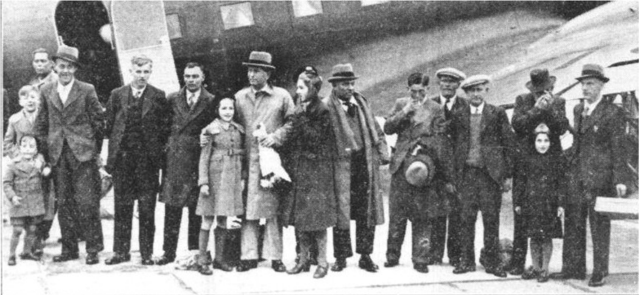
Overlevenden van de 'Den Haag' bij terugkeer in Nederland, Schiphol, 26 februari 1940.