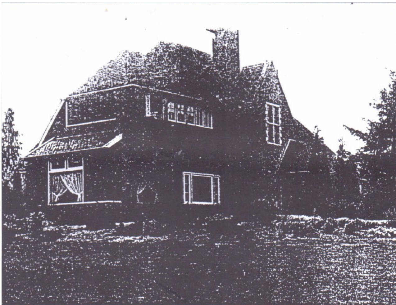
De villa op de hoek Rijksweg Amsterdam-Amersfoort/Vredelaan Laren. Circa 1970 heeft de villa moeten wijken voor de verbreding van de snelweg A1.

Keulen de eerste joden werden gedeporteerd, hadden de gebroeders Horn met haar over vluchten gcsproken. Was deze gefortuneerde, Duits sprekende dame mei connecties bij de politie in Nederland geen uitgelezen kans om onder te duiken? De broers vonden van wel.